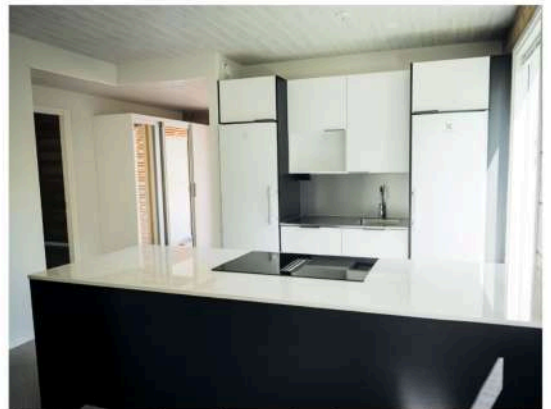
Keittiön vasemmalla puolella on eteinen ja asunnon sisäänkäynti.