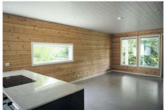
Näkymä kolmion olohuoneeseen. Vasemmalla keittiösaareke, jonka ääressä voi tehdä ruokaa ja sen jälkeen halutessaan myös nautiskella tehtyjä aterioita.